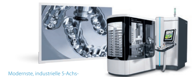
Modernste, industrielle 5-Achs-Fräszenter mit Roboter-Automation.